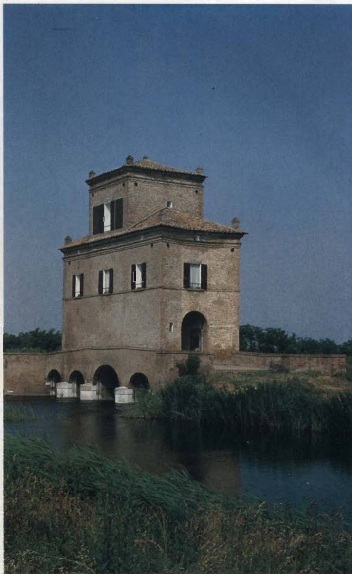
5. L'argine del Po presso Serravalle.